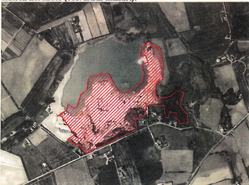
Assens Kommune, 12. marts 2013

Den meddelte tilladelse gælder det areal, der er markeret med rødt på skitsen herunder (obs. IKKE målfast):