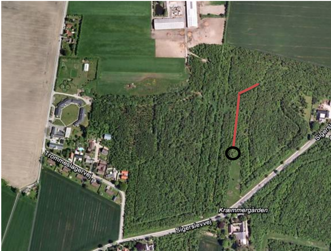
Figur 1. Angivelse af grøftens forløb